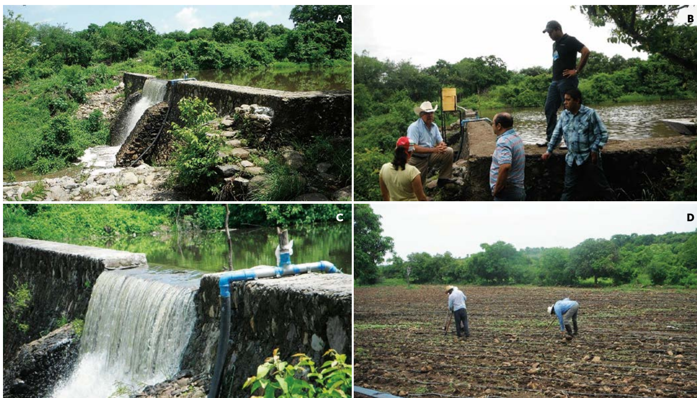
Figura 2. A-C: Represa que recoge escurrimientos pluviales. B: Productores, Técnicos e Investigadores integrados en el proyecto. D: Aplicación de riego presurizado.

introducción de hortalizas de invierno micro-irrigadas. En el 2012 se ferti-irrigaron 1.5 ha (tres ciclos por año) con un rendimiento equivalente de 5 \text{ t ha}^{-1} por ciclo y una parcela con frijol en 0.4 ha que produjo un rendimiento equivalente a 1.8 \text{ t ha}^{-1} . La relación beneficio costo en el área utilizada fue de 3:1. Durante cada año los productores vendieron el maíz tanto en elote (fisiológicamente inmaduro) como en grano, según los precios del momento. En 2012-2013 la misma parcela de frijol rindió 2.4 \text{ t ha}^{-1} y en 2014, una de 540 \text{ m}^2 produjo el equivalente a 3.3 \text{ t ha}^{-1} . Desde el 2013 se les ha estado capacitando en el sistema intensivo de producción de hidroponía orgánica con sub-riego automático, sin el uso de bombas o contadores de tiempo ni dosificación de soluciones nutritivas. Se sembraron 4000 mojarra tilapia en la represa. A la fecha están en operación tres hectáreas y cuatro bebederos automáticos para el ganado. En 2013 y 2014 han surgido problemas con un grupo de ejidatarios (4 de 80) que aun teniendo habilitada su parcela, no desean que el proyecto continúe. En ese tiempo la capacitación profundizó en temas completamente nuevos para los productores (relaciones agua-suelo-atmósfera) expuestos de manera comprensible usando un léxico sencillo; así, gradualmente se van haciendo cargo del sistema y aportando también sus conocimientos prácticos en mu-