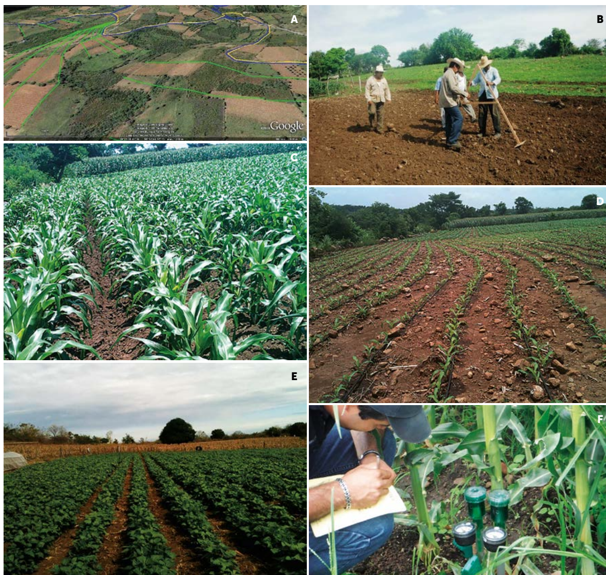
Figura 3. A: Trazo general de irrigación. B-D: Trazo de curvas a nivel con triángulo "A" para siembra de maíz. E: Siembra de frijol. F: Registro de datos en tensiómetros.

mostrarán un cambio positivo como el que se espera; y se estará en condiciones de tomar ventaja de los efectos de las lluvias torrenciales que llenen rápidamente las pequeñas represas, con lo que se podrá mejorar la calidad de vida de los pobladores del ámbito rural.